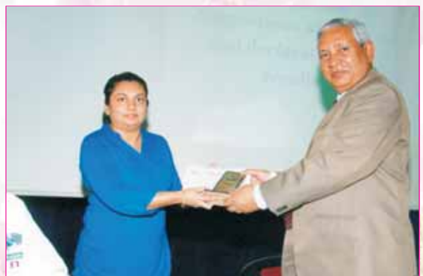
Law Test Third Prize