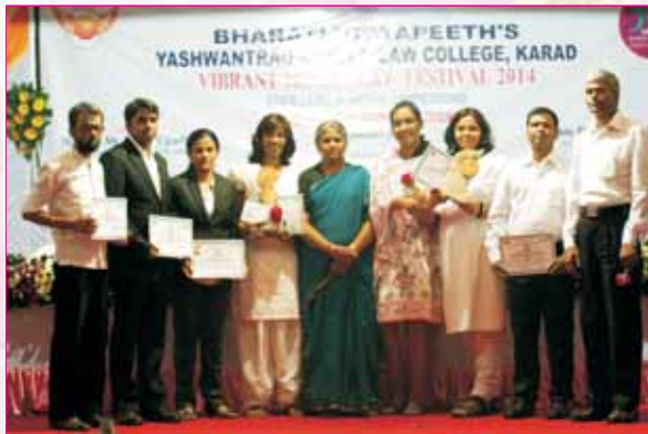
Our team at Karad Law College