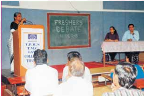
Introduction of Judges