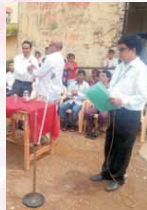
Legal Literacy Camp - Mamdapur