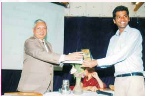
Law Test Second Prize