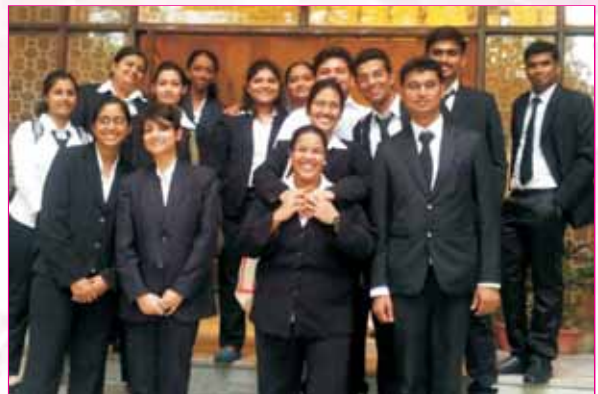
Our team at 13 th Henry Dunant Memorial Moot Court, New Delhi