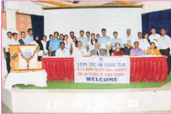
Participating teams with the Judge & Coordinators of Bedekar Debate