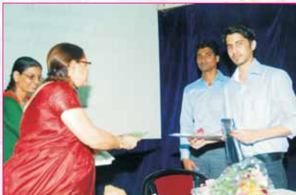
Our college teams receiving the 1st prize