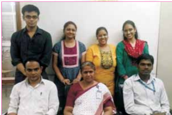
Participants in the University Youth Festival